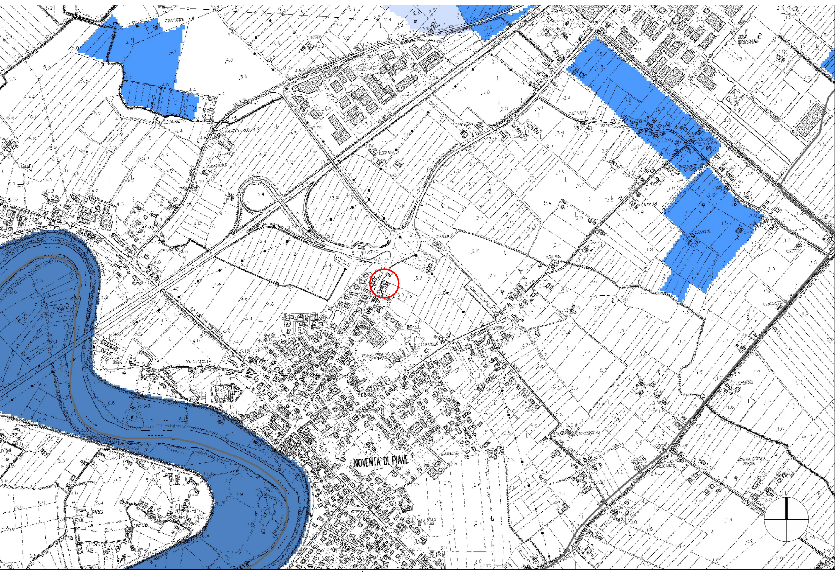
CARTA DELLE ALTEZZE IDRICHE SCENARIO DI ALTA PROBABILITÀ - TR 30 ANNI SCALA 1:10.000