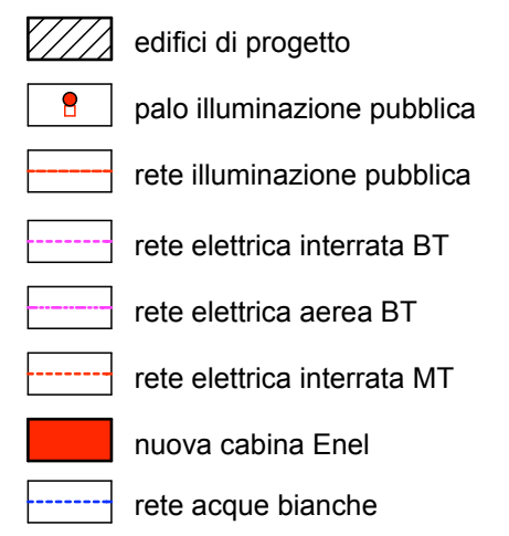
TAV. 9- Reti e manufatti di progetto